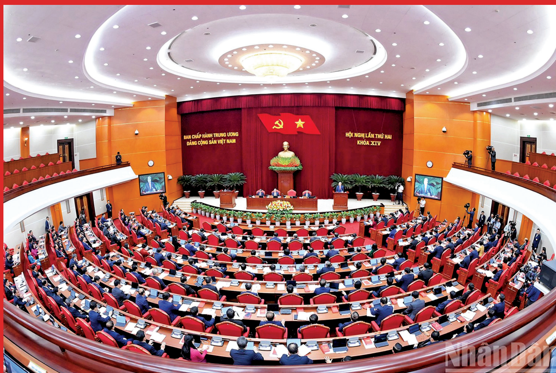
Quang cảnh Hội nghị lần thứ hai Ban Chấp hành Trung ương Đảng khóa XIV