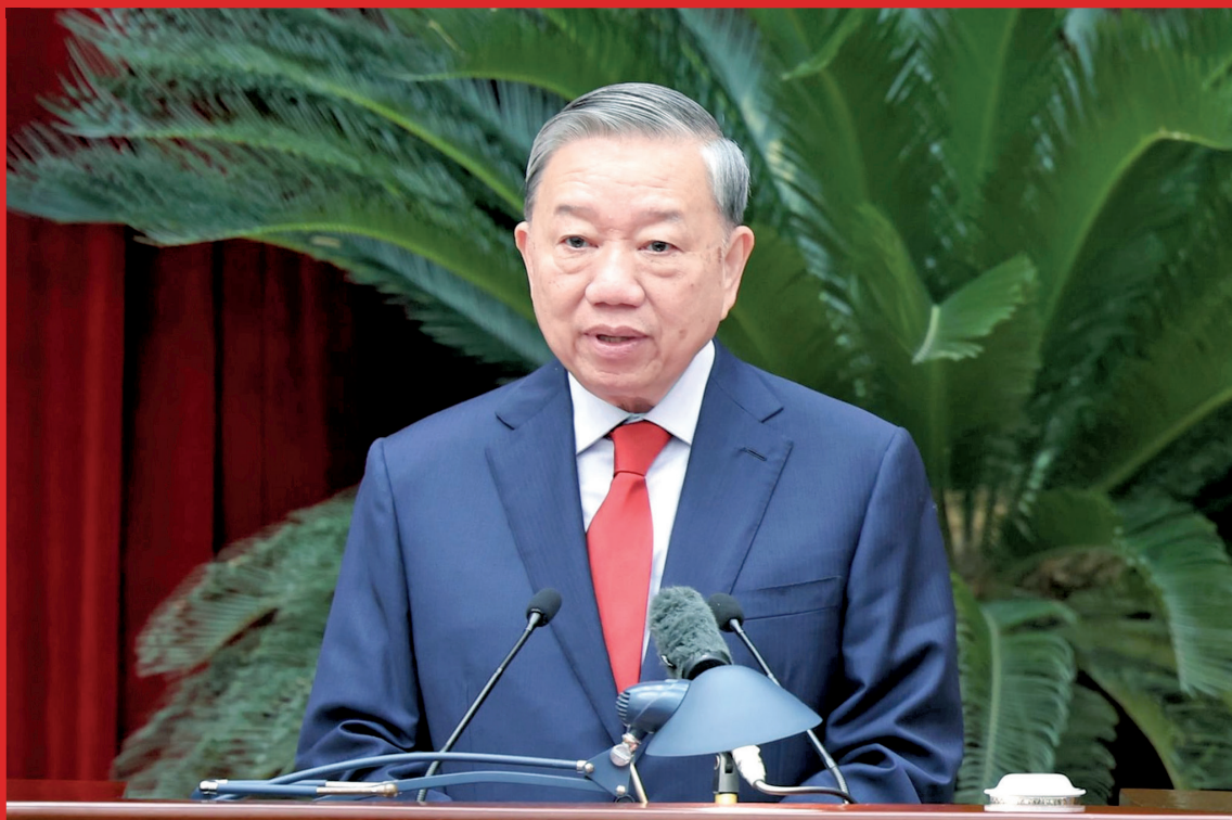
Tổng Bí thư Tô Lâm phát biểu tại Hội nghị lần thứ hai Ban Chấp hành Trung ương Đảng khóa XIV