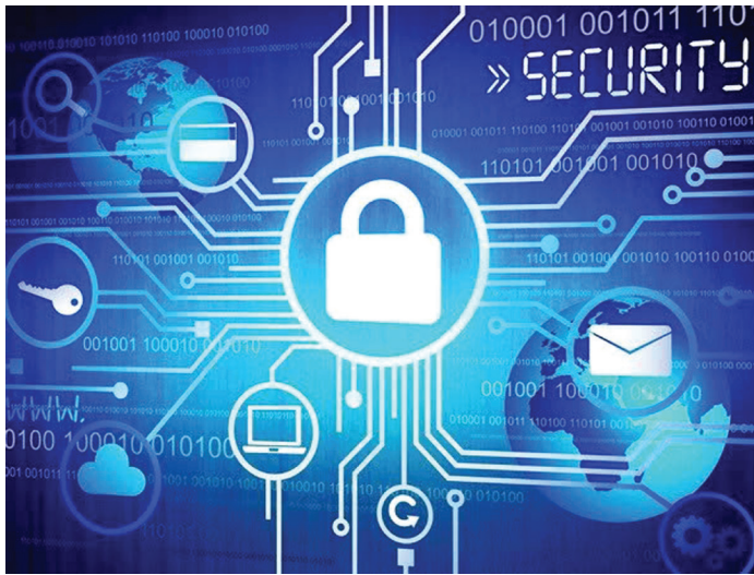
Hình ảnh minh họa

1. Mục tiêu chung: Xây dựng không gian mạng tỉnh Khánh Hòa vững mạnh, có năng lực phản ứng nhanh với mọi sự cố mất an toàn thông tin. Phân đầu đưa Khánh Hòa vào nhóm các tỉnh dẫn đầu về chỉ số an toàn, an ninh mạng, góp phần bảo đảm môi trường số ổn định cho công cuộc chuyển đổi số toàn diện, phát triển kinh tế - xã hội, bảo đảm quốc phòng - an ninh, xây dựng Đảng và hệ thống chính trị vững mạnh.