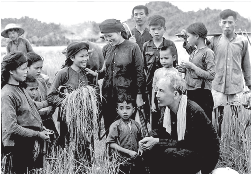
Tư tưởng lấy dân làm gốc của Chủ tịch Hồ Chí Minh

Quan điểm “Dân là gốc - thước đo cao nhất của mọi quốc sách” của Đảng ta đang kết trái nhiều thành tựu đầy hứa hẹn là nhờ đã kế thừa tư tưởng của Bác Hồ - nhà cách mạng vĩ đại suốt đời đầu đầu một chữ “dân”. Ngày 05/4/1948, Bác viết bài báo lịch sử “6 điều không nên và 6 điều nên làm”, mở đầu bài viết là chân lý: “ Nước lấy dân làm gốc ”. Để cổ động, Bác viết bài thơ: “ Mười hai điều trên/ Ai chả làm được/ Hễ người yêu nước/ Nhất quyết không quên/ Tập thành thói quen/ Muôn người như một/ Quân tốt, dân tốt/ Muôn sự đều nên/ Gốc có vững, cây mới bền/ Xây lầu thắng lợi trên nền Nhân dân ”.